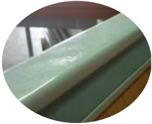
Ceinture tôle plié 40 x 25 mm