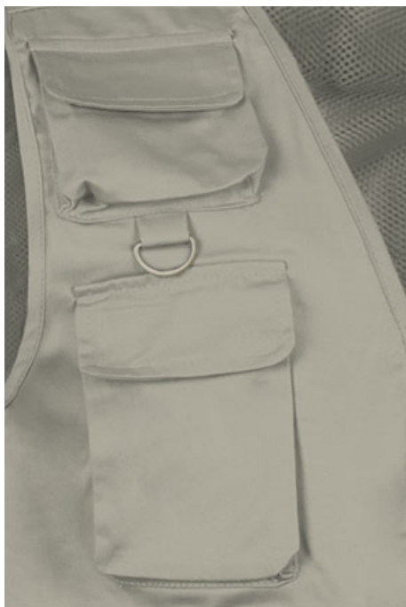
Détail poches et anneau poitrine côte droit