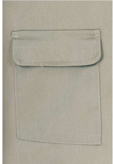
Détail poche avec rabat en bas du dos