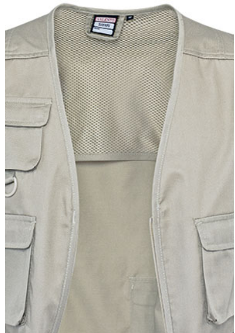
Détail filet intérieur dans le haut du dos