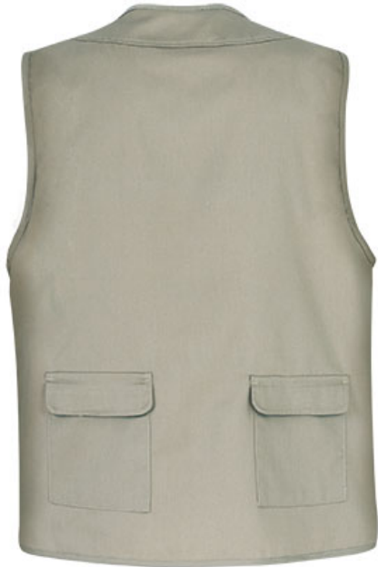
Vue de dos du vêtement