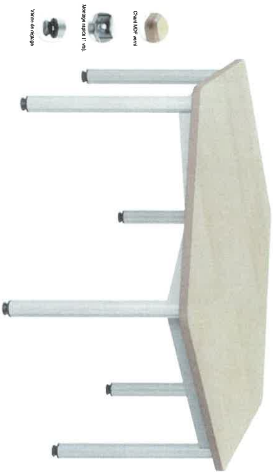
Chant MDF verni