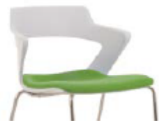
SEAT UPH assise revêtue