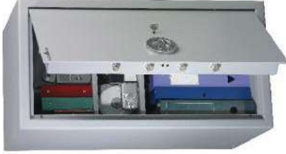
MB 80, 2 tablettes réglables en hauteur au pas de 40 mm.

Protection anti-effraction norme européenne EN 14450. Classe S2 (uniquement les modèles avec serrure à clé). Blindage anti-perçage au manganèse du système de condamnation. Protection anti-feu.