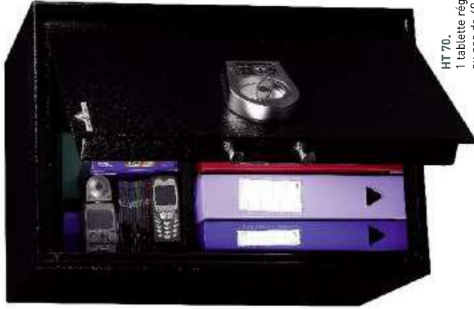
HT 70, 1 tablette réglable en hauteur au pas de 40 mm.