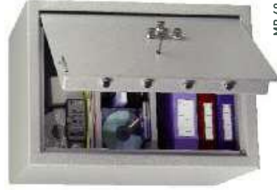
MB 60, 2 tablettes réglables en hauteur au pas de 40 mm.