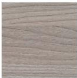
BACO BACO BACO