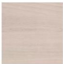
HAYA BEECH HÊTRE