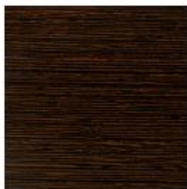
WENGE WENGE WENGE