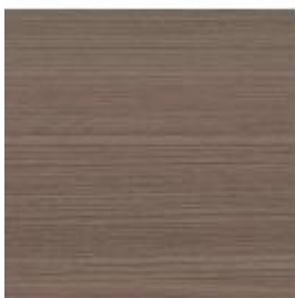
TEKA TEAK TECK