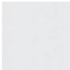
BLANCO WHITE BLANC