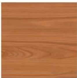
CEREZO CHERRY CERISIER