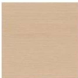
ROBLE OAK CHÈNE