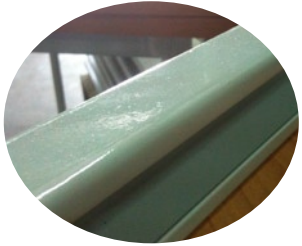
Ceinture tôle plié 40 x 25 mm