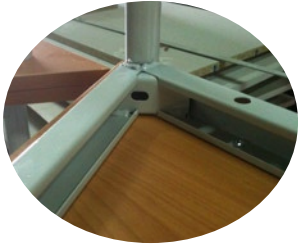
Pieds tube rond 30 mm