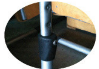
Réglage par clé allen