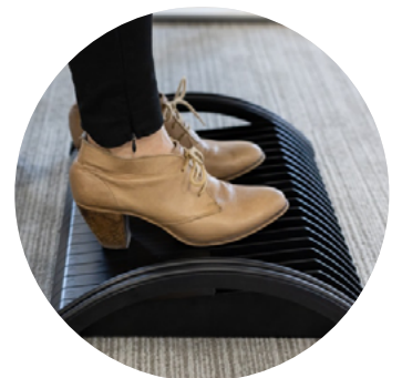
Mode d'utilisation statique