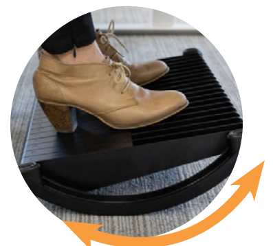
Mode d'utilisation dynamique