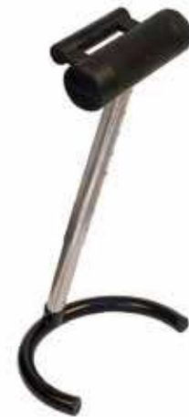
7KA 82FXYO 00 905