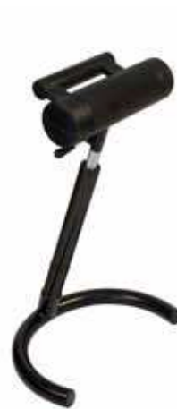
7KA 80YHFO 00 905