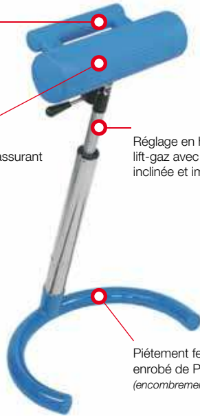
7KA 80XHFO 00 512

Piètement fer à cheval acier enrobé de PVC plastifié satiné. (encombrement : L 490 x P 330 mm)