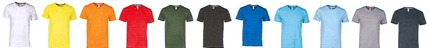
BLANC JAUNE ORANGE ROUGE VERT NOIR BLEU ROI BLEU ATOLL BLEU AZUR GRIS ACIER BLEU MARINE