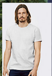
SOLIS IMPERIAL 11500