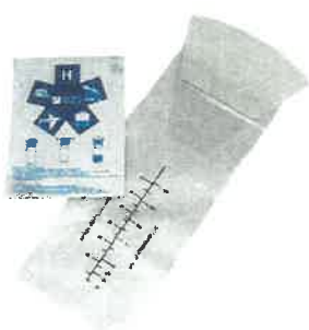
Sac vomitoire gradué 1000ml avec valve anti-retour - la pièce