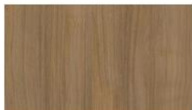
07 Noyer Classique