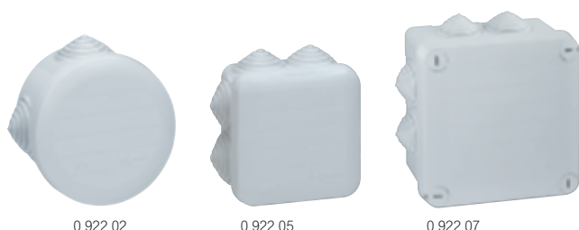
0 922 02

avec embouts à gradins, IP 55 - IK 07 - 650 °C