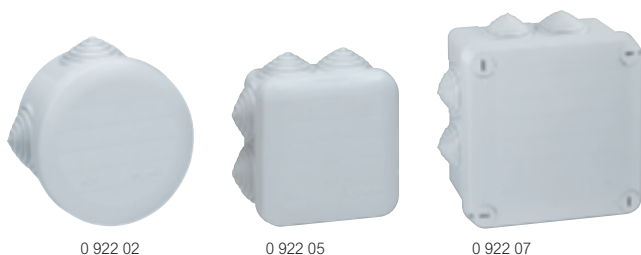
0 922 02

avec embouts à gradins, IP 55 - IK 07 - 650 °C